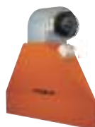
Barriere d'aria per evitare la dispersione termica da portoni e grandi aperture di edifici industriali e commerciali.