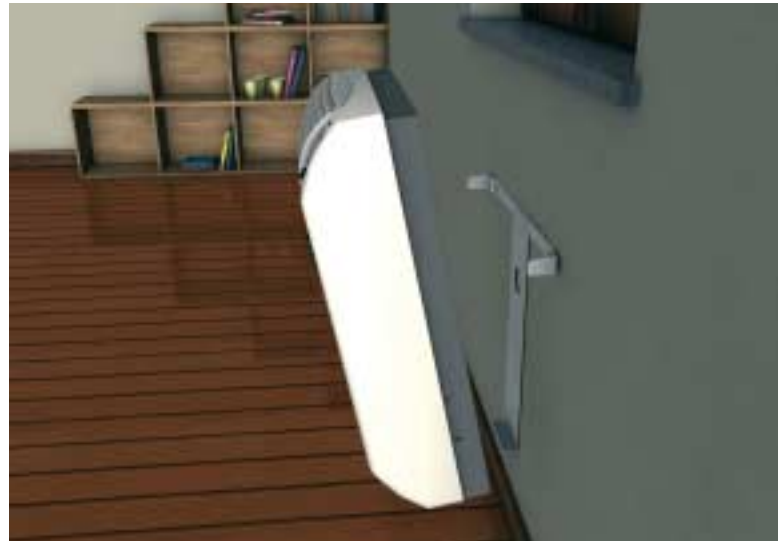
Veloce e facile da installare grazie alla staffa ad innesto rapido

Grazie al sistema di combustione a tiraggio forzato, i radiatori Calorio permettono di realizzare il collegamento dei condotti aria/fumi all'esterno in ogni condizione di installazione.