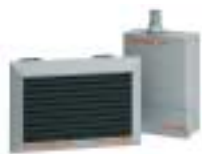
Sistemi combinati di riscaldamento caldaia e aerotermo a metano/GPL, per riscaldamento di ambienti di media e grande dimensione.