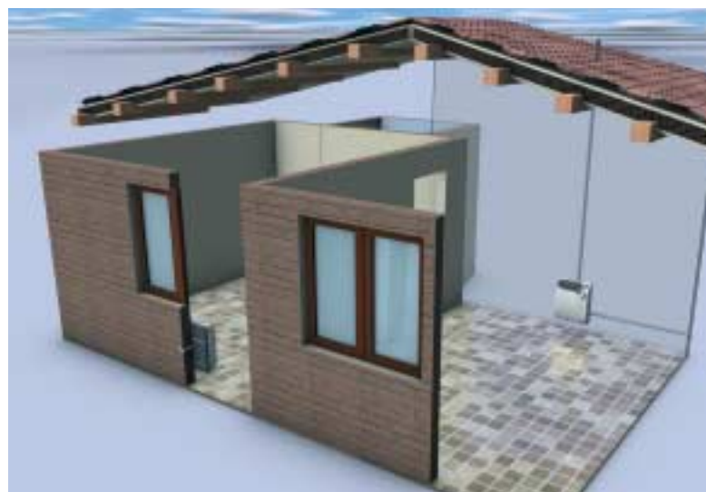
Un impiego flessibile grazie al condotto coassiale sdoppiato a parete/tetto