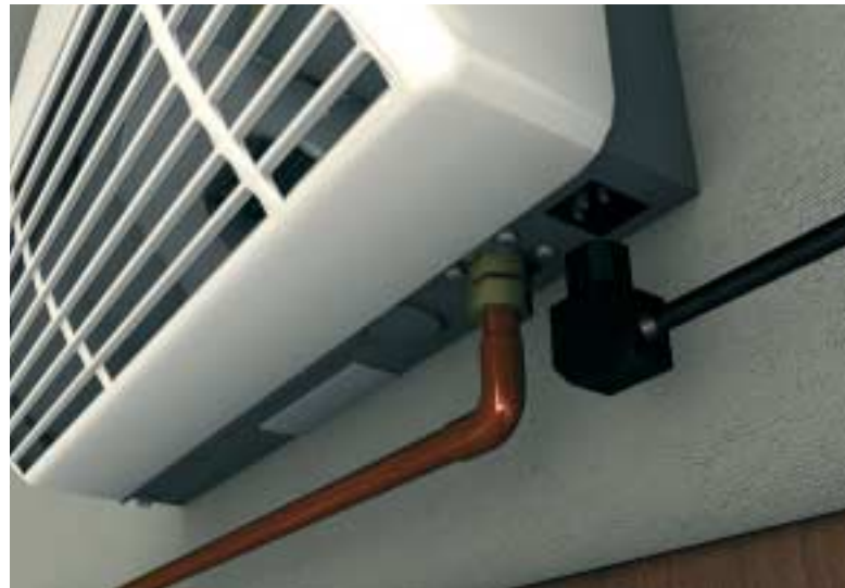
Sicuro, affidabile ma soprattutto modulare