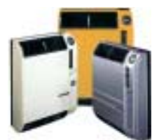
Radiatori individuali Supercromo a scambio diretto alimentati a metano/GPL per riscaldare ambienti di piccole e medie dimensioni.